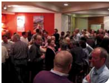
Angeregte Diskussionen in der Lobby-Bar