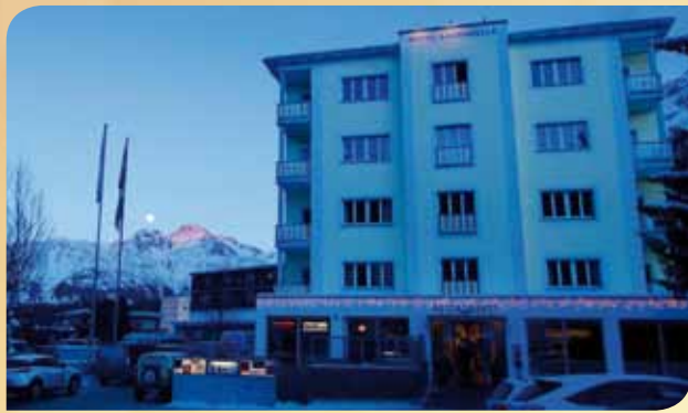
Laudinella bei Nacht