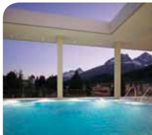
Ovavera: Schwimmen mit Aussicht, relaxen in der Salzkammer