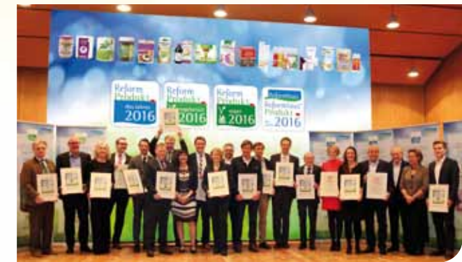
Die Preisträger des Wettbewerbs „Reformprodukt des Jahres 2016“