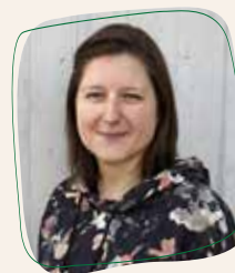
Sylvia Kuhry Kommunikation